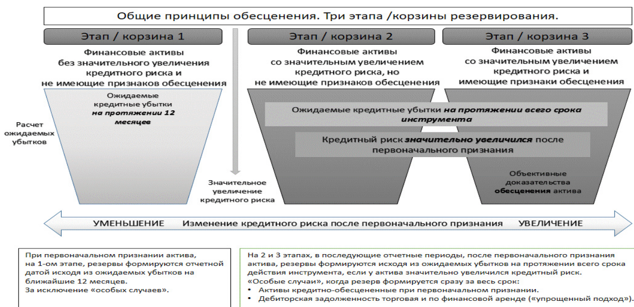
Схема этапов резервирования